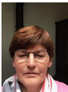
Inge Neven Opvang Bellestraat